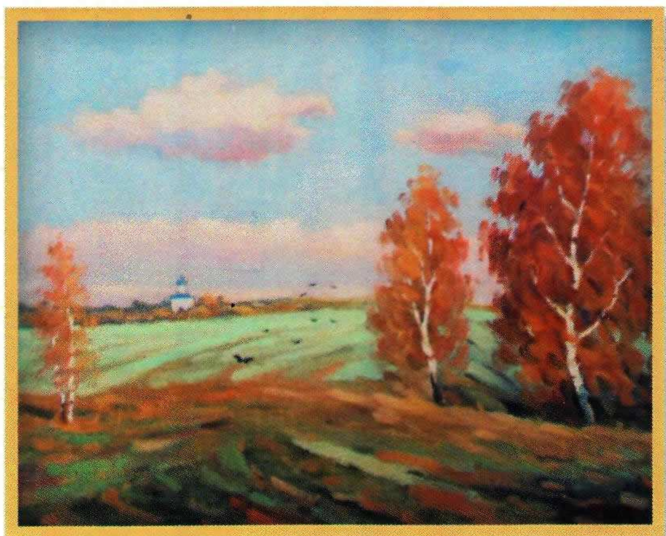
В.И. Недомерков «Осенний пейзаж» Холст, масло. 2013