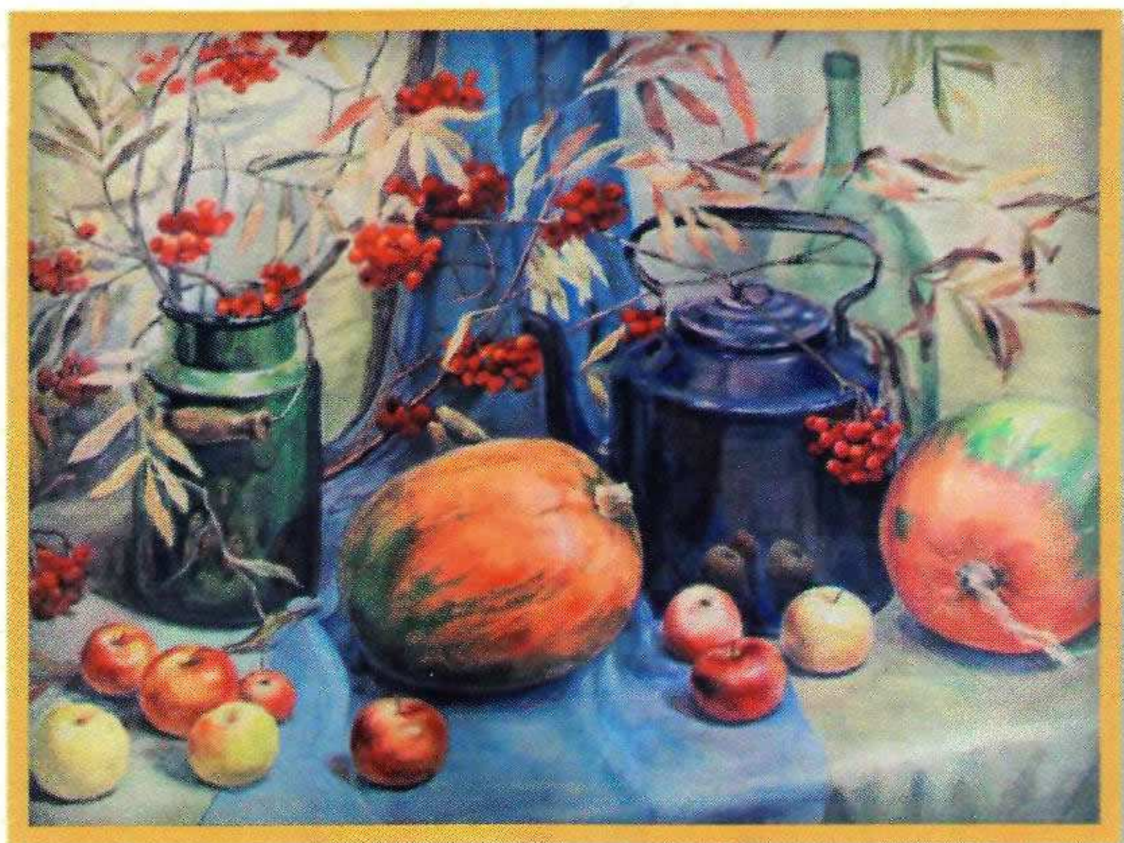
Е.В. Таранина «Бабье лето» Бумага, гуашь. 2010