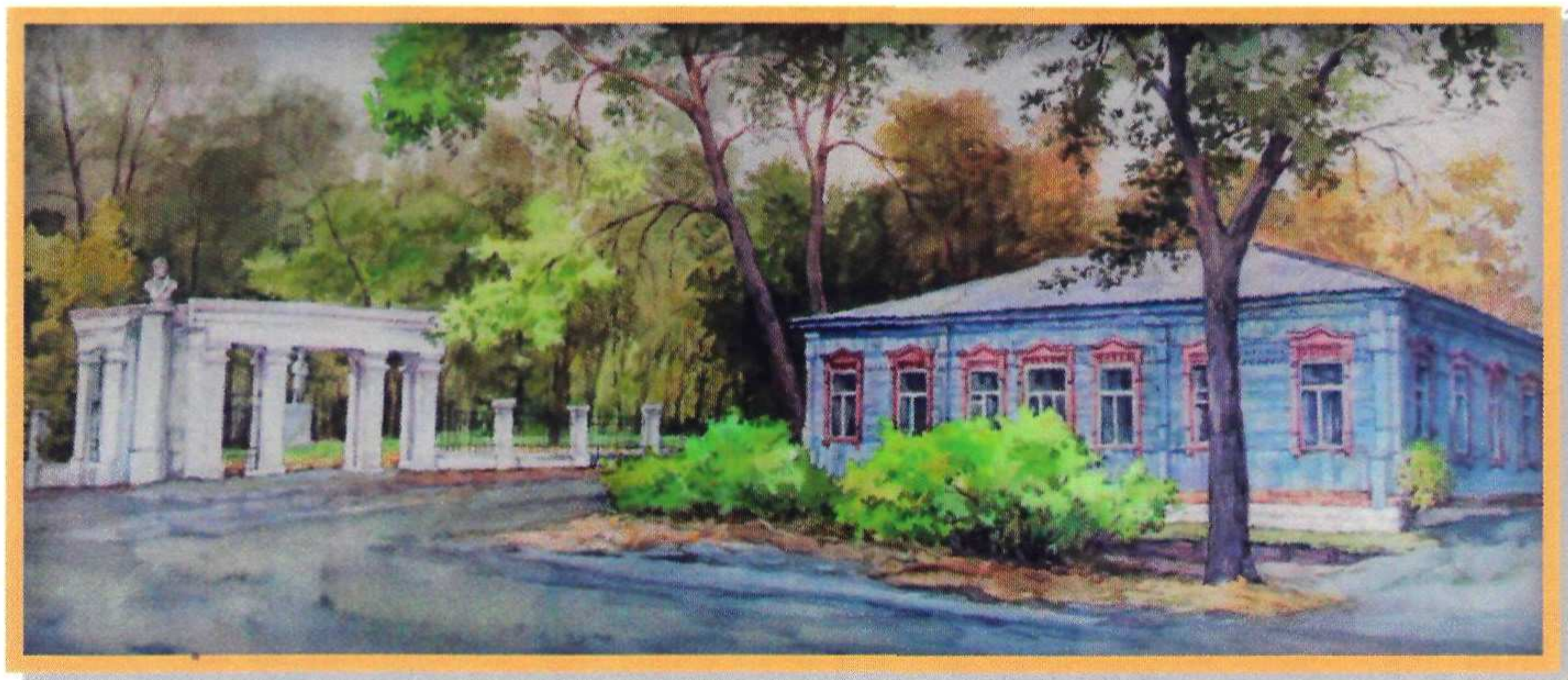
Н.Ю. Белов «Ковров. Парк Пушкина» Бумага, акварель. 2013